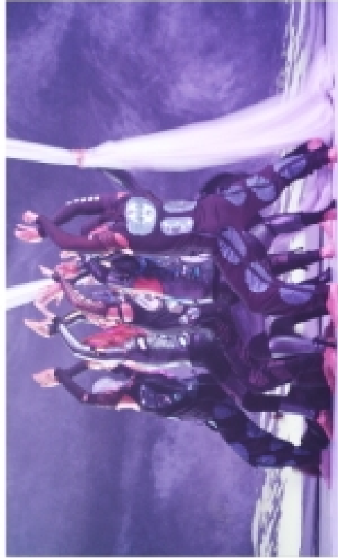
Les "Araignées de Mars" ne sont pas sans rappeler les personnages du dessinateur Elio Bili.

Prochain rendez-vous : vendredi 5 octobre, c'est deux spectacles, sinon rien. D'abord "Reflets", avec la compagnie 3 temps 3 mouvements. Puis "Toi et moi & moi et toi" de la compagnie S'Point. Lever de rideau par l'école primaire arquoise Jules-Leprieux. Barnoisnements au 03 21 88 94 80.