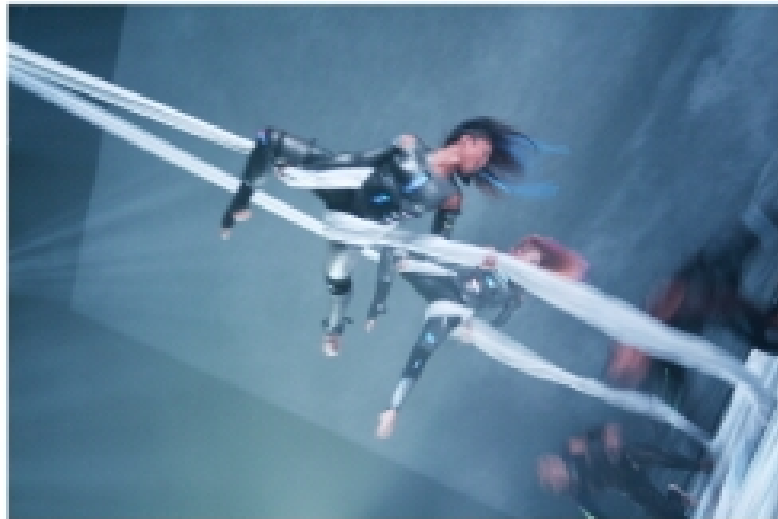
Des créatures futuristes glissent le long de leur toile, dans une chorégraphie qui offre danser contemporains et films rétroscifi.