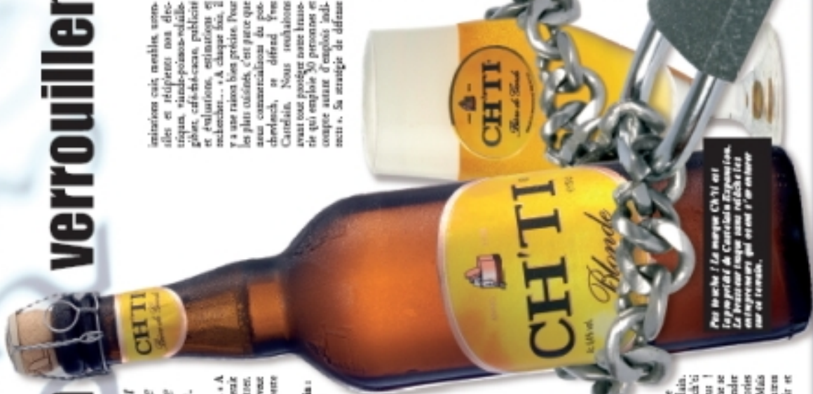
Pour protéger la marque Ch'vi et la propriété de Castelains Espérance, la brasserie a même verrouillé son produit.

« Bienvenue chez les Ch'vi » est une marque déposée par Yves Castelain. Toute réimpression ou utilisation non autorisée sans la permission écrite de la Brasserie Castelains est formellement interdite.