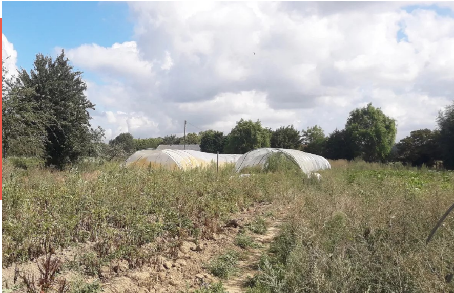
Un terrain agricole à Comines, dans la métropole lilloise.

Par Simon Henry - 25 septembre 2020 - 6 minutes - 1